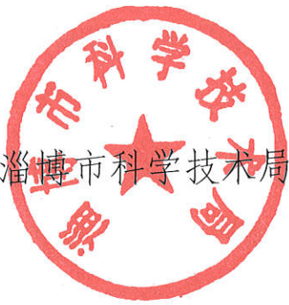
淄博市科学技术局