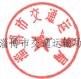
淄博市交通运输局