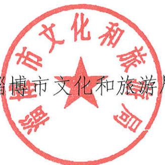
淄博市文化和旅游局