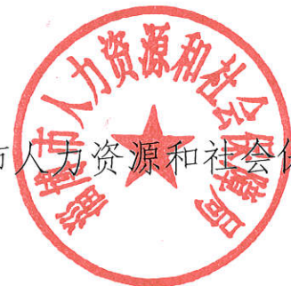
淄博市人力资源和社会保障局