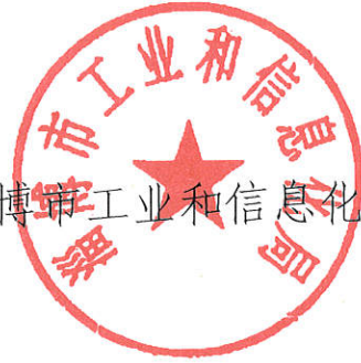
淄博市工业和信息化局